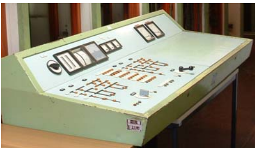
Anwahlsteuerung, KW Lippendorf, 1969