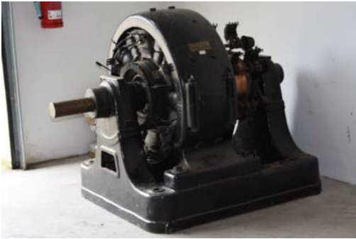
Siemens-Motor, um das Jahr 1900